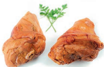
Prekajene krače Smoked pork shank / Stinco affumicato