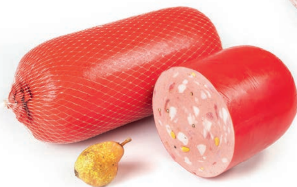
Mortadela Peloz Mortadella Peloz / Mortadella Peloz