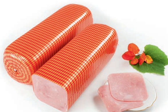
Pizza šunka Pizza ham / Prosciutto pizza