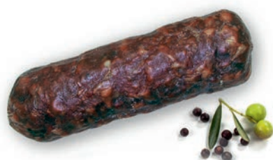
Salama napoli pikant Salami napoli piquant / Salame napoli piccante