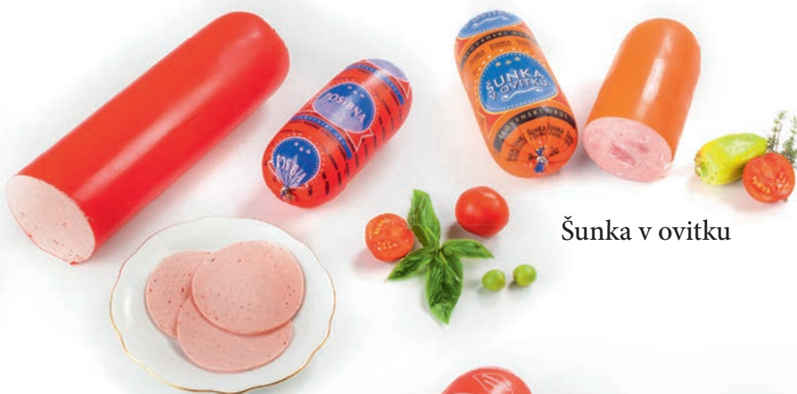
Šunka v ovitku