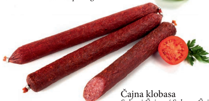
Čajna klobasa Salami Čajna / Salame Čajna