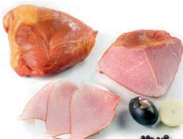
Prekajena šunka Smoked ham / Coscia cotta