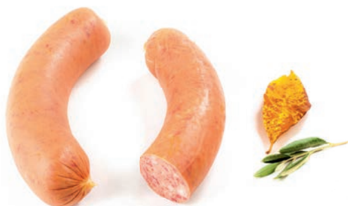
Lovska salama Hunter's salami / Salsiccia del caccatore