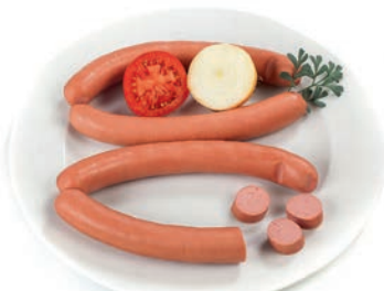
Hrenovka Sausage dog / Salsiccia tipo Viena