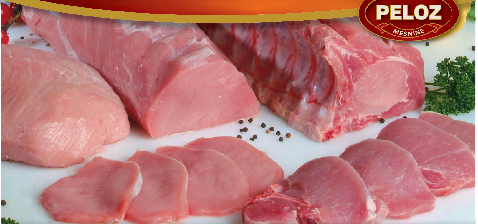
Svinjsko meso: svinjsko stegno, svinjski lax kare, svinjski kare s kostjo Pork meat / Carne suina