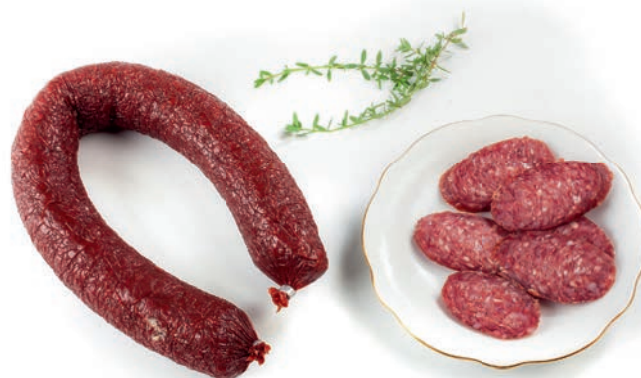
Sudžuk Sudžuk / Sudžuk