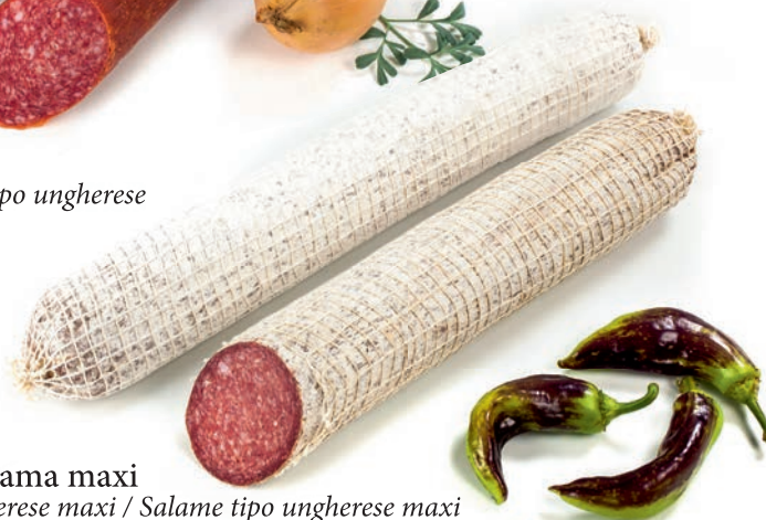
Ogrska salama maxi Salami ungherese maxi / Salame tipo ungherese maxi