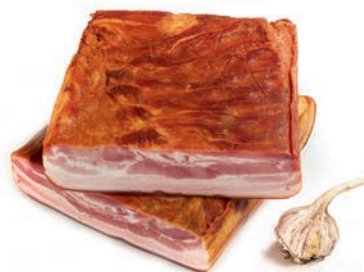
Prekajena panceta Cooked bacon / Pancetta affumicata