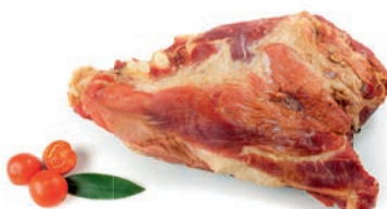
Prekajeni prsni vršički Smoked tops ribs / Puntine affumicate