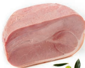
Kuhan pršut Cooked ham / Prosciutto cotto