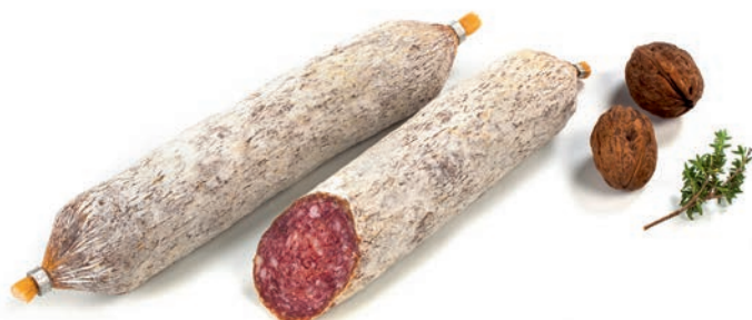
Salamin Salmin / Salamino