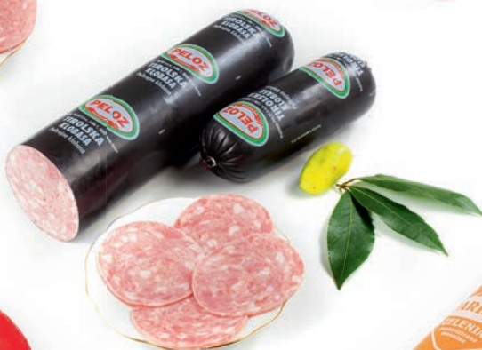
Tirolska salama Salami Tyrol / Salame Tirolo