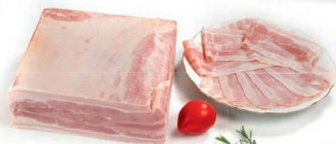
Kuhana mesna slanina Cooked bacon / Pancetta cotta doppia