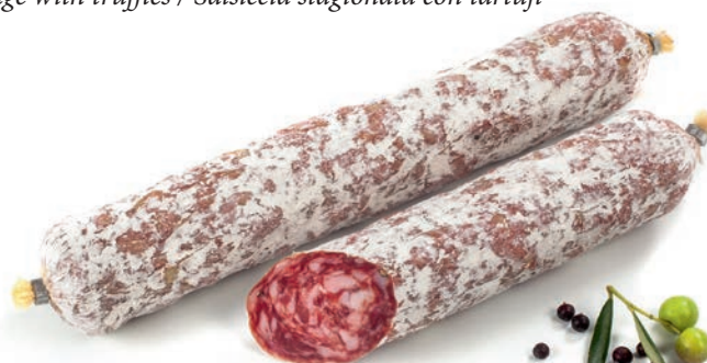
Furlanska salama Salami friulano / Salame friulano