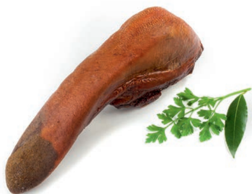
Prekajeni goveji jezik Smoked beef tongue / Lingua bovina affumicata