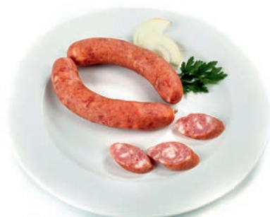
Primorska klobasa Sausage Primorska / Salsiccia Primorska