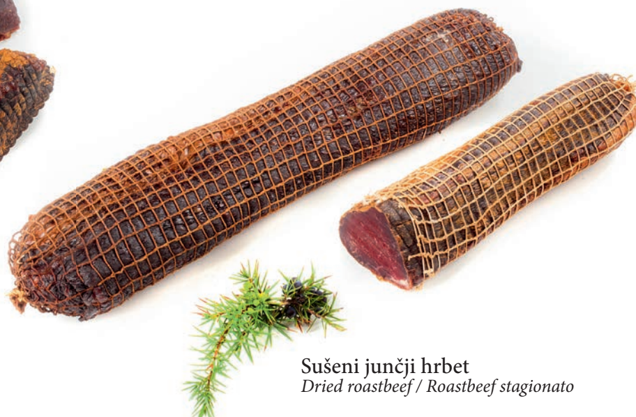
Sušeni junčji hrbet Dried roastbeef / Roastbeef stagionato