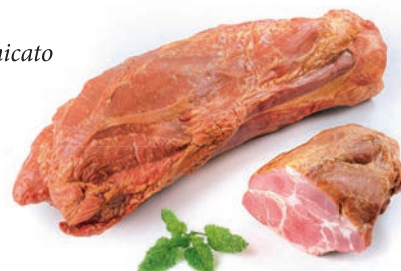
Prekajeni vrat Smoked neck / Collo affumicato