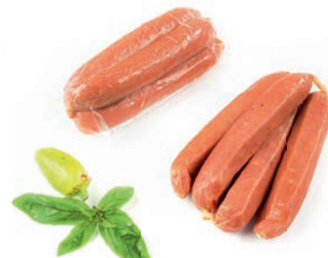
Klobase za kuhanje Sausage for cooking / Salsiccia da cucina