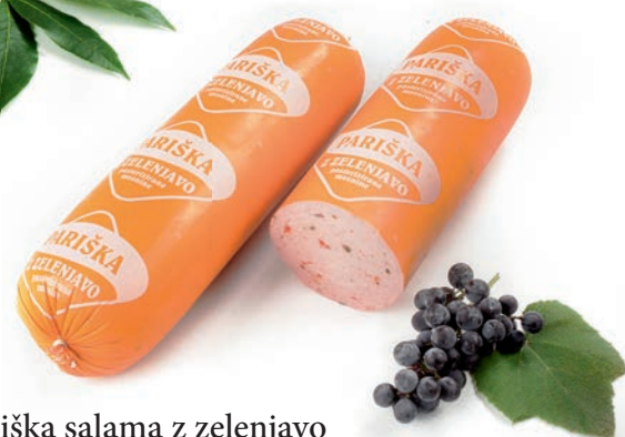
Pariška salama z zelenjavo Paris salami with vegetables / Salame Pariser con verdura