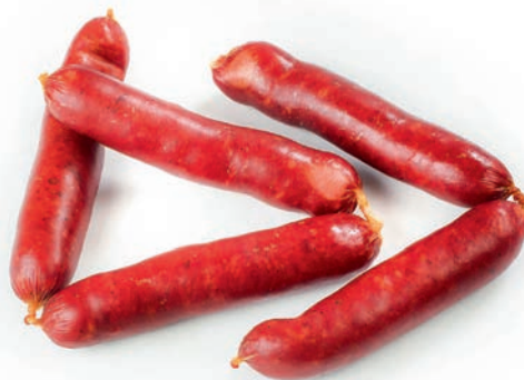
Goveji konci Beef sausage / Salsiccia bovina