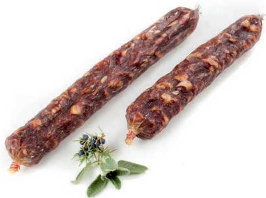
Goveja salama Beef salami / Salame bovino