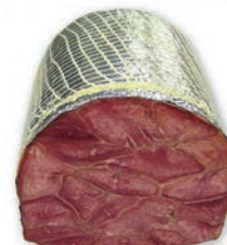
Prekajeni jezik Smoked pork tongue / Lingua suina cotta