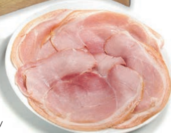
Pečen pršut SK Baked ham bone in / Prosciutto cotto c/o tipo Praga