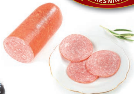
Dunajska salama Vienna salami / Salame Vienesse