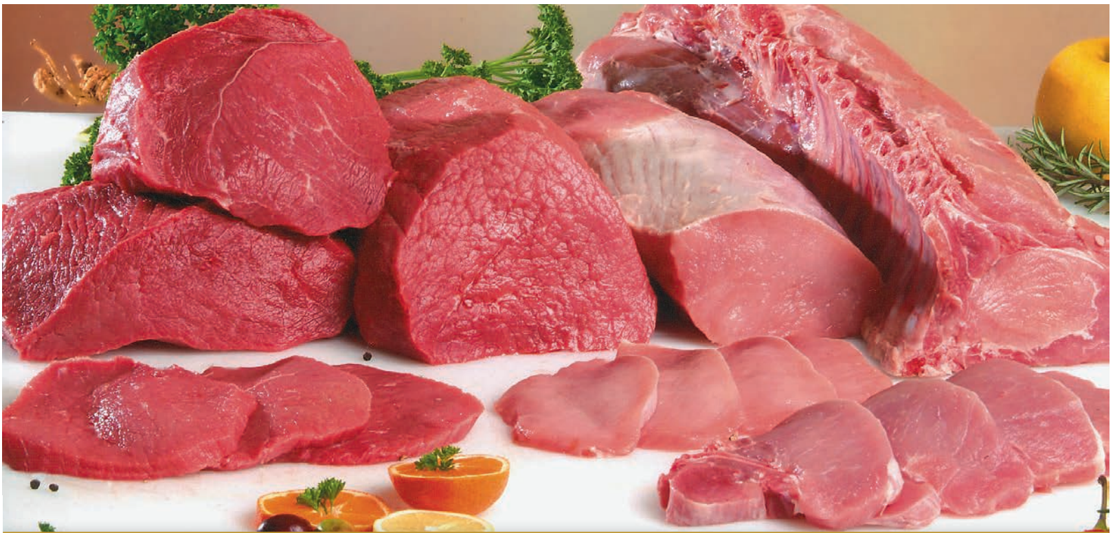
Junčje in svinjsko meso: junčje stegno, svinjski lax kare, svinjski lax Beef and pork meat / Carne bovina e suina

Glavna dejavnost v naših prodajalnah je prodaja sveže mesa. V naši ponudbi je junčje, telečje in prašičje meso; meso drobnice in divjačine, perutnine in kuncev. Ponujamo junčje in telečje meso izključno slovenskega porekla. Živali odkupujemo od slovenskih - primorskih kmetov iz Vipavske doline in Krasa. Zavedamo se, da je najbolj pomembno zaupanje strank zato zagotavljamo visoko kakovostno, zdravo in varno hrano. Sledljivost zagotavljamo od hleva do krožnika. Našim kupcem ponujamo le najboljše domače meso.