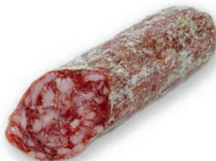
Milanska salama Salami milano / Salame milanese