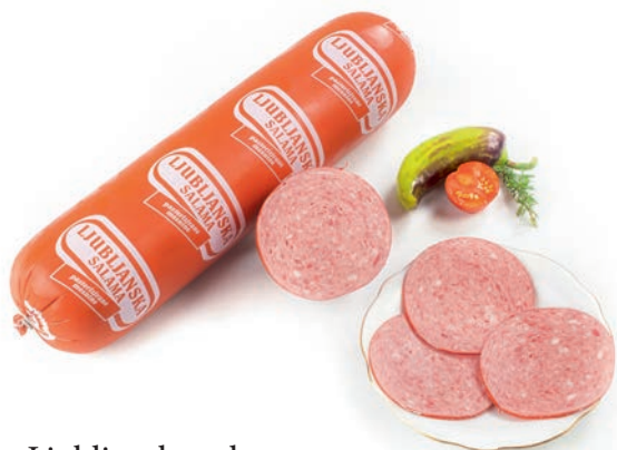
Ljubljanska salama Ljubljana salami / Salame Lubianska