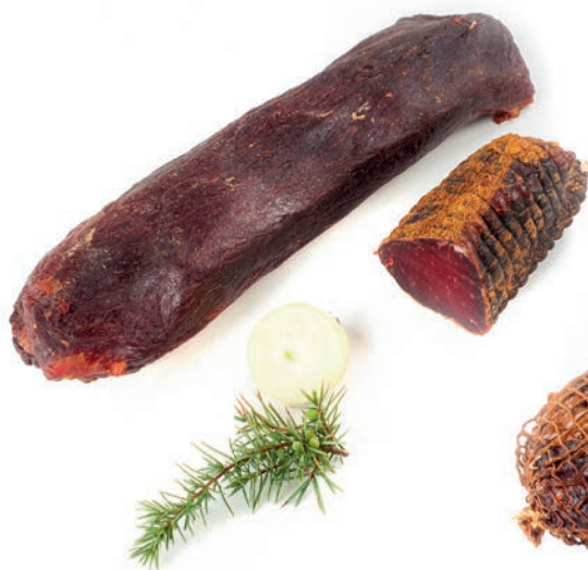
Sušena govedina Dried beef / Bovino stagionato