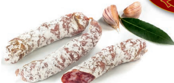
Trajna domača klobasa Dried sausage / Salsiccia stagionata